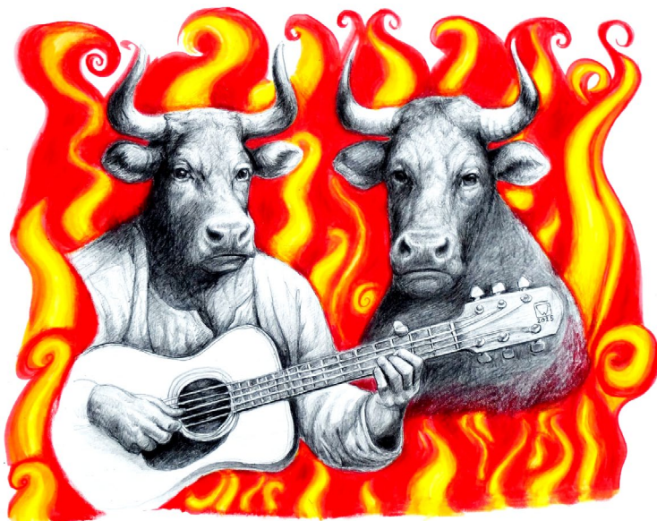
Illustration : Gaëtan Wittamer

La fête du bœuf fera son grand retour le samedi 25 octobre 2025, toute la journée sur le Pouech. Un rendez-vous attendu qui promet partage et bonne humeur, juste avant l'arrivée de l'hiver !